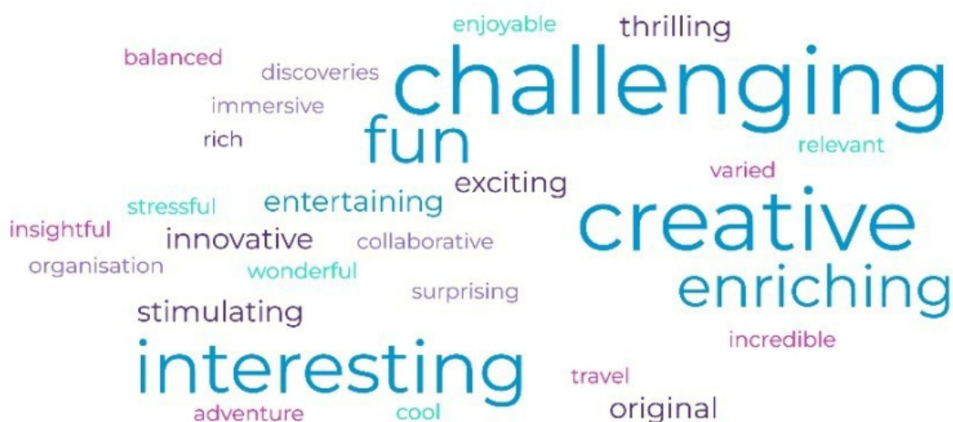
Figure 1 – Nuage de mots généré à partir du feedback des étudiants en réponse à la question 5 (voir Annexe 2)

35 Dans l'ensemble, les retours d'expérience des étudiants étaient donc très positifs, ce qui s'est reflété dans la qualité des travaux rendus et donc dans les notes obtenues. Ces retours constituent par ailleurs une ressource précieuse pour ajuster et enrichir notre démarche pour de futures réitérations du projet.